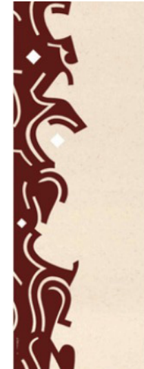
وسام شوكت "سيمفونية ٣". ٢٠١٥. كريبليك على ورق معالج يدوياً. ياذن من تشكيل.