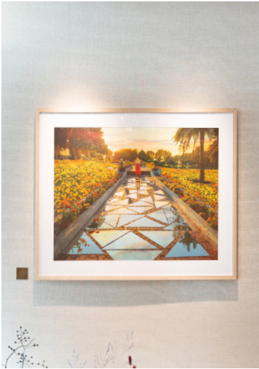
لطيفة بنت مكتوم "مسار التفكير". ٢٠١٧. طباعة أرشيفية على ورق. ياذن من تشكيل.