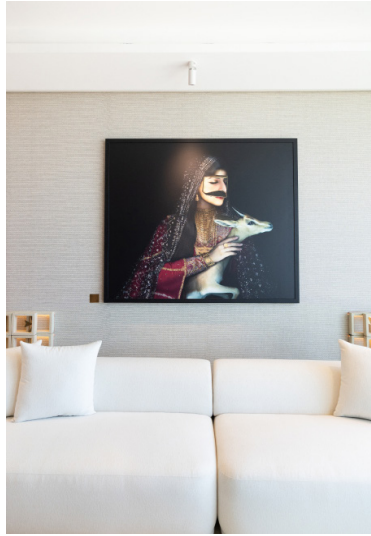
لميثاء دميثان "غزال". ٢٠١٨. مسرح رقمي لطباعة رقمية. ياذن من تشكيل.