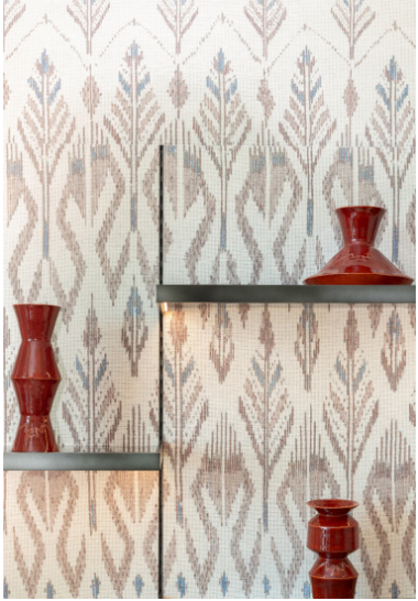
سارة المداح، مصممة صنعت الفخاريات الخزفية المخصصة لتناسب مع هوية الدار.