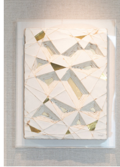
جوفيريا مهدي "بدون عنوان رقم ١٠". ٢٠٢٢. ورق، نار، هفانج نحاسية، شبكة نحاسية، طلاء زيتي، ورق ذهبي. ياذن من تشكيل.