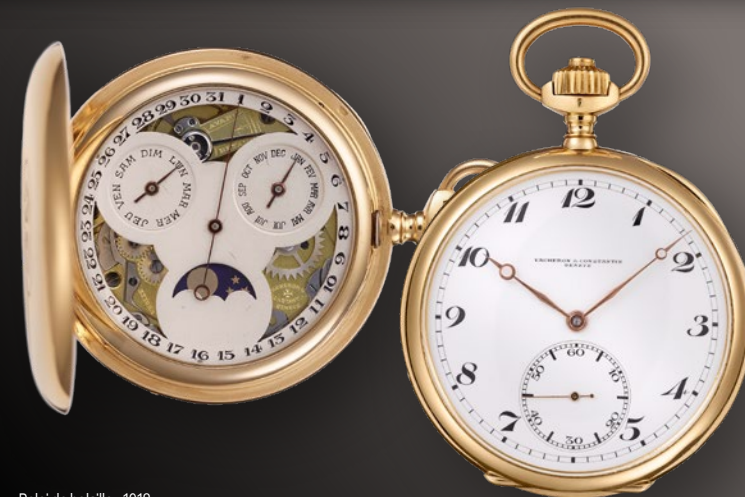
Reloj de bolsillo - 1918

En 2019, el calendario perpetuo Traditionnelle Twin Beat se inscribe en esta dinámica, aprovechando el juego de tensiones entre el estilo contemporáneo y el poder de la tradición. Fue un verdadero hito. Dos años más tarde, en 2021, nació una nueva interpretación: el calendario completo Traditionnelle de esfera descubierta. Esta elegante referencia, presentada en una caja de 41 milímetros de oro blanco o rosa con esfera de zafiro despejada, abrió nuevas posibilidades creativas al combinar la tradición y el acervo de la alta relojería con el diseño contemporáneo.