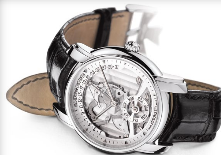
Fecha retrógrada esqueletizable en platino, Ref.47247-2002