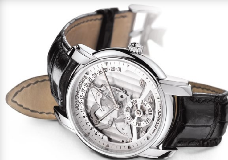
逆跳日历镂空铂金腕表，参考编号47247 - 2002年