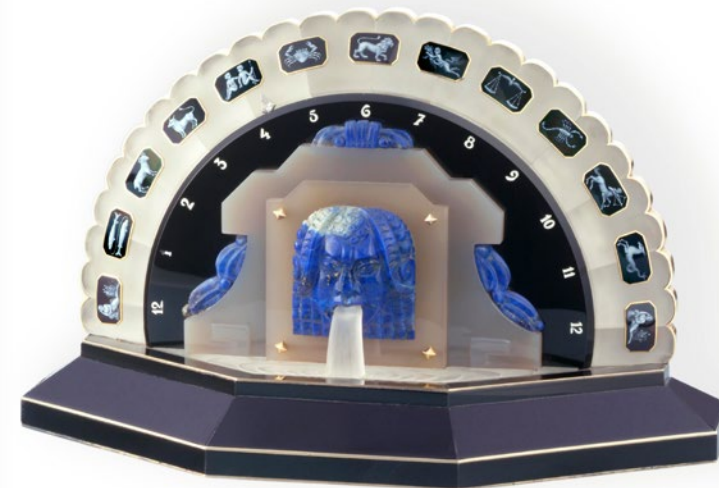
装饰艺术（Art Deco）座钟，以黄金、缟玛瑙、水晶和青金石材质打造（典藏编号10546）-1927年

以21世纪初问世的参考编号47245和47247腕表为启发，新款腕表不仅具备逆跳显示，还采用了局部镂空表盘设计，这也是自20世纪初以来江诗丹顿时计作品的另一标志性特色。这一先锋的美学设计，将腕表精湛的技术内涵以及对于入微细节的专注展现得淋漓尽致。此款新作采用直径41毫米、厚度仅11.07毫米的18K粉红金表壳，搭配灰色鳄鱼皮表带及粉红金折叠式表扣。