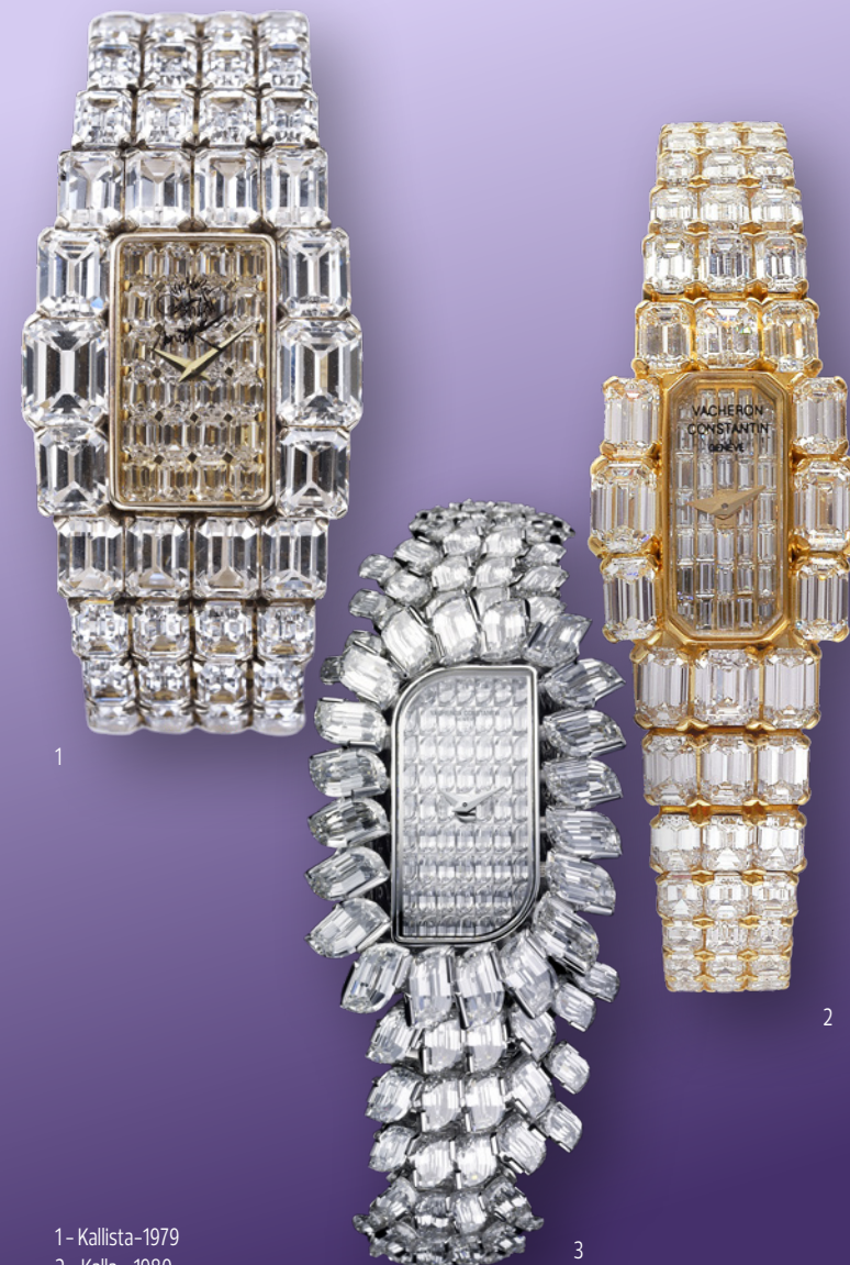
1 - Kallista-1979 2 - Kalla - 1980 3 - Lady Kalla Flamme-2010