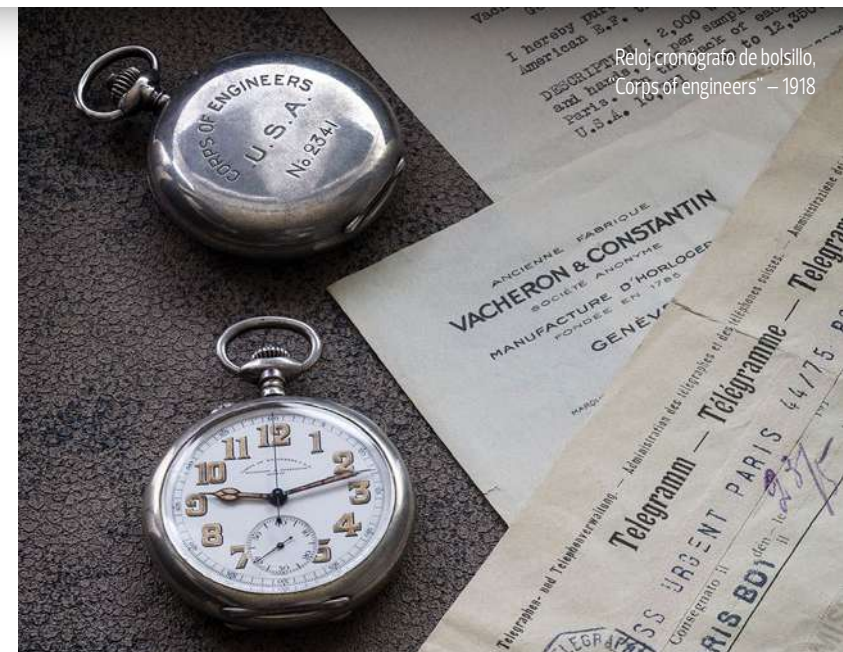
Reloj cronógrafo de bolsillo, Corps of engineers - 1918

Aquella también fue la era en la que el reloj de pulsera empezó a imponerse como la nueva norma relojera, adornado por los toques de fantasía típicos del espíritu de la época. En este periodo destaca la estética del American 1921, un diseño desarrollado por Vacheron Constantin durante estos años de intensa creatividad, al que ahora se rinde homenaje con el nuevo Les Cabinotiers Tourbillon Armilar - Homenaje al estilo art déco .