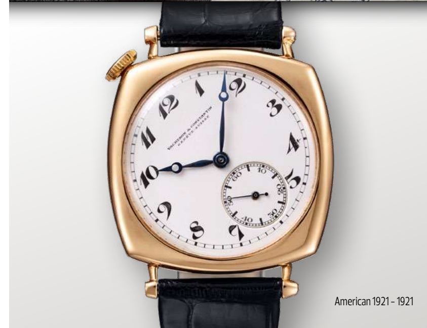
American 1921 - 1921