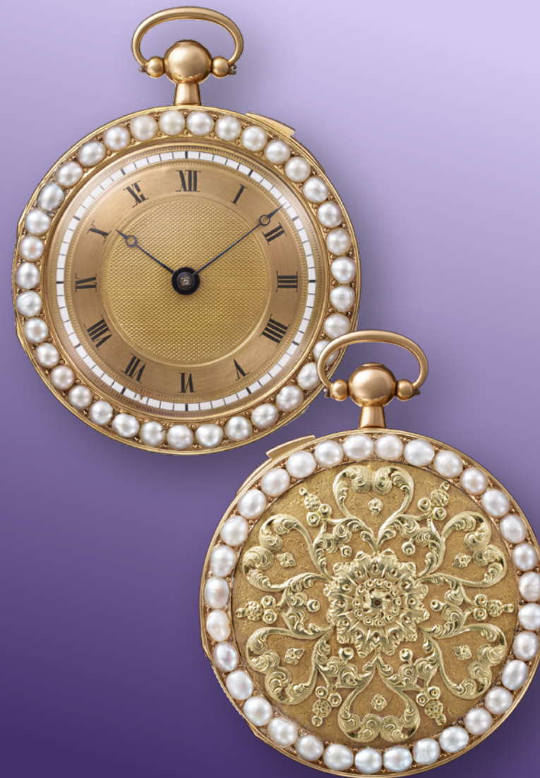
Round pocket watch - 1812