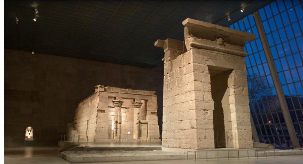
The Met Fifth Avenue, The Temple of Dendur

Le partenariat entre Vacheron Constantin et le Met, qui inclut le soutien à différentes activités liées à la mission du musée, comprendra un certain nombre de collaborations, notamment dans le registre éducatif et de résidence d'artistes. Des événements spéciaux seront également organisés, des montres exceptionnelles inspirées des œuvres que l'on peut admirer parmi les collections du Met verront le jour.