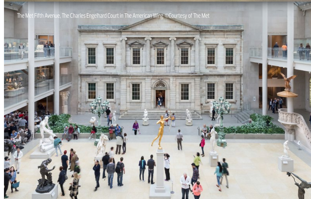
The Met Fifth Avenue, The Charles Engelhard Court in The American Wing