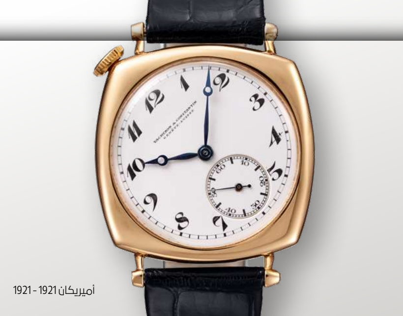
أميريكان 1921 - 1921

وكان ذلك أيضًا هو الوقت الذي بدأت فيه ساعة اليد في ترسيخ نفسها كمعيار جديد في صناعة الساعات، مصحوبة بلمسات خيالية نموذجية لروح العصر. تميزت هذه الفترة بشكل خاص بجمالية ساعة أميريكان 1921، التي هممتها فاشرون كونستنتان خلال هذه السنوات من الإبداع المكثف والتي يتم الاحتفال بها الآن مع ساعة "لي كايينوتيه آر ميلاري تورييون - تحية لأسلوب آرت ديكو".