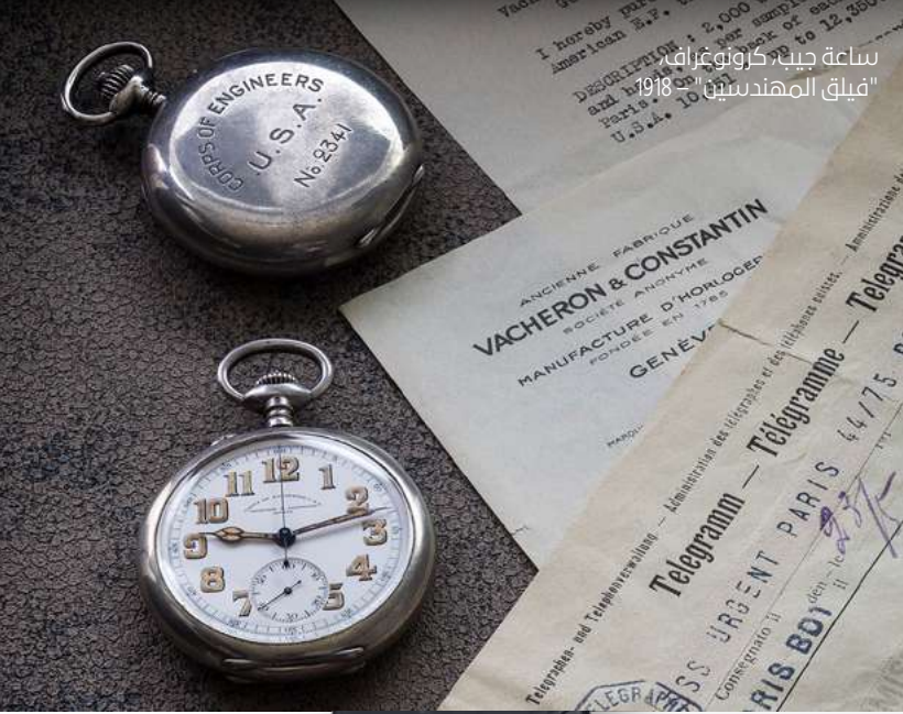
ساعة جيب كارولوغراف "فيلق المهندسين" 1918