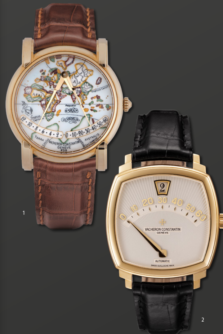
1. Montre bracelet Mercator en or (Ref. Inv. 12130) - 1994 2. Montre bracelet Saltarello en or jaune, affichage des heures sautantes et minutes rétrogrades (Ref. Inv. 11000) - 1997

Cette signature esthétique se retrouve dans les nouveautés 2023 de la Maison, déclinée dans les collections Overseas, Patrimony, Traditionnelle et au cœur de la pièce à exemplaire unique Les Cabinotiers Dual Moon Grande Complication. Ces pièces symbolisent l'horlogerie propre à Vacheron Constantin où la technique est au service de l'élégance.