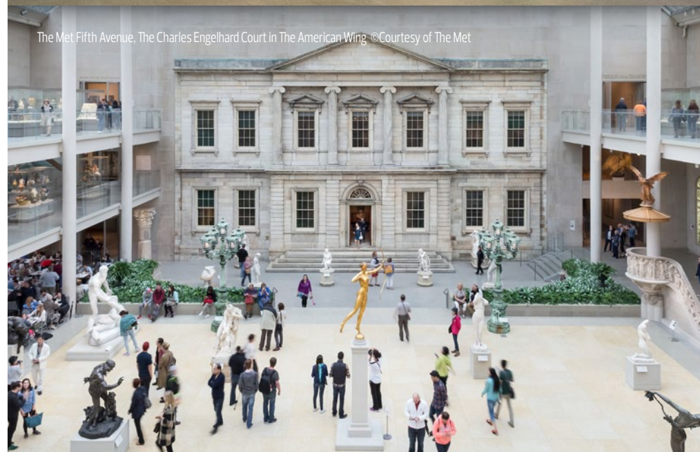
The Met Fifth Avenue, The Charles Engelhard Court in The American Wing