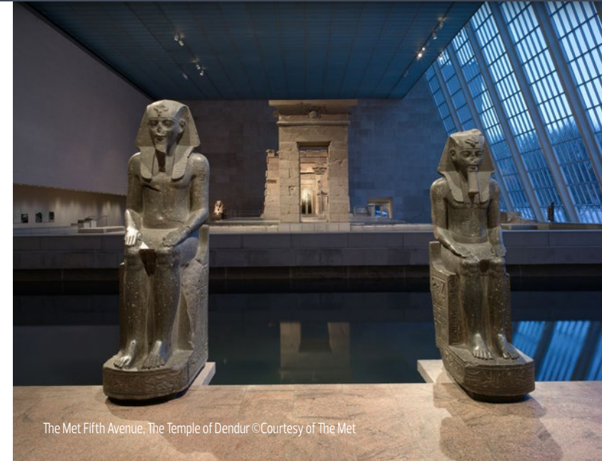
The Met Fifth Avenue, The Temple of Dendur

Estes programas incluem workshops, experiências de estágio em arte, visitas especializadas, bolsas de estudo para apoiar as principais áreas de investigação e estudos, estágios em escolas secundárias e faculdades que promovem a acessibilidade e a diversidade nas profissões artísticas, programas de acesso para visitantes com deficiências, programas para educadores do ensino básico e secundário que preparam os professores para integrar a arte nos currículos de base de todas as disciplinas e visitas e programas escolares que promovem uma aprendizagem aprofundada e relações ao longo da vida com e através da arte.