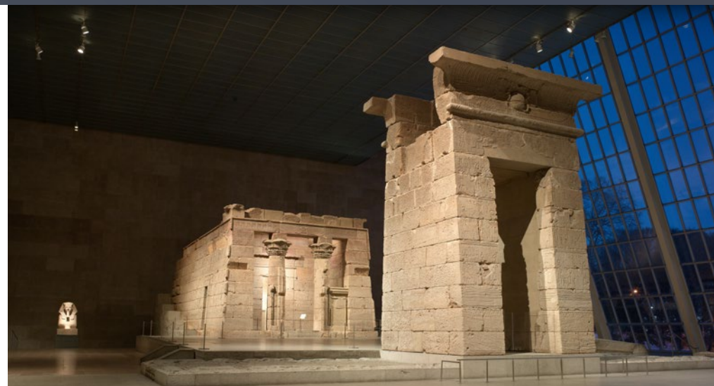
The Met Fifth Avenue, The Temple of Dendur

A parceria apoiará uma variedade de atividades impulsionadas pela missão do Met e incluirá uma série de colaborações, incluindo um programa de estágio artístico e outras iniciativas educativas; eventos especiais; e a criação de relógios Vacheron Constantin excecionais e únicos inspirados em obras de arte da coleção do Met.