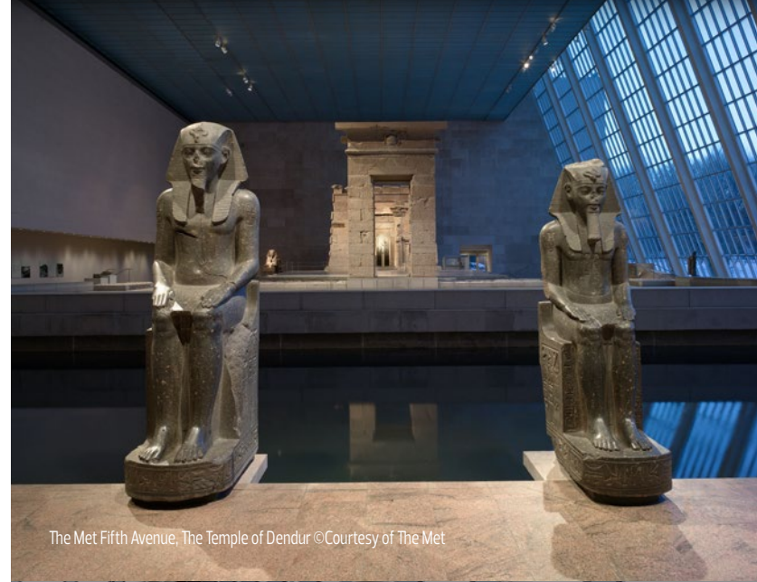
The Met Fifth Avenue, The Temple of Dendur

이 프로그램에는 워크숍, 예술 작품 제작 경험, 전문 투어, 선구적인 장학금 및 연구를 지원하는 연구비, 커리어 접근성 및 다양성을 장려하는 고등학교 및 대학교 인턴십, 장애가 있는 방문객들을 위한 프로그램, 다양한 분야의 핵심 커리큘럼에 예술을 통합할 수 있도록 교사를 양성하는 K-12 교육 전문가 프로그램, 예술을 통한 심도 있는 학습 및 평생 동안 예술과의 관계를 쌓아갈 수 있도록 하는 학교 투어 및 프로그램이 포함됩니다.