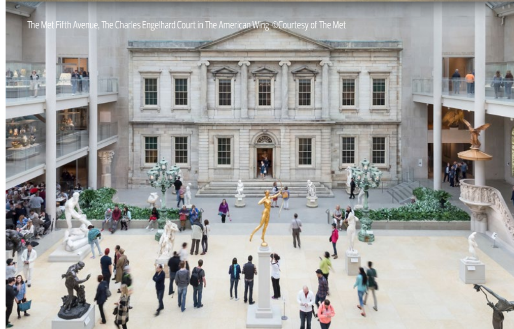
The Met Fifth Avenue, The Charles Engelhard Court in The American Wing