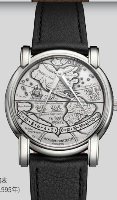
Mercator铂金双逆跳显示腕表 (参考编号43050, 诞生年份1995年)