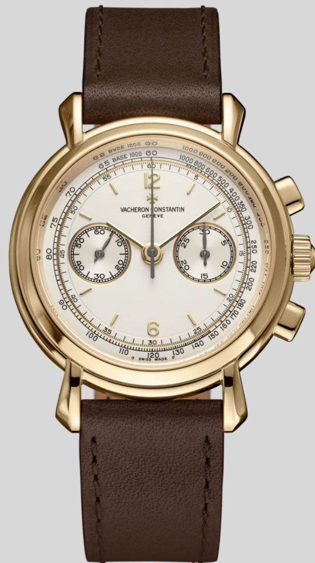
Historiques历史名作系列黄金计时腕表 (参考编号47111, 诞生年份:2000年)