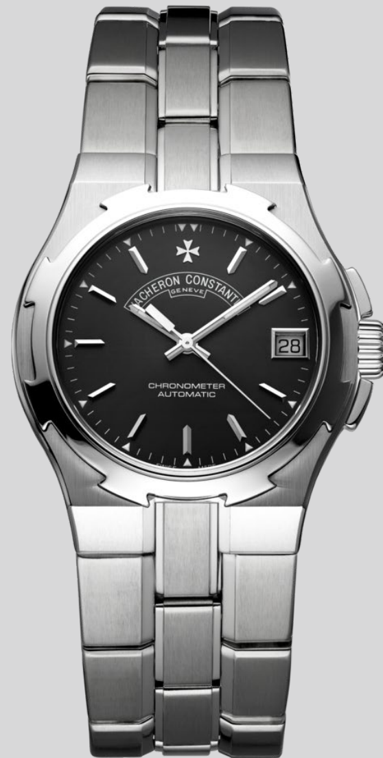
Overseas纵横四海系列第一代一体式表链精钢腕表 (参考编号42050, 诞生年份:1998年)

问世于1998年的Overseas纵横四海系列第一代一体式表链精钢腕表(参考编号42050),堪称江诗丹顿现代运动风尚腕表的典范杰作,为运动风格腕表注入品牌独有的优雅风格,与经典的222腕表一脉相承。此款腕表以精钢材质搭配煤灰色表盘,经典耐看,作为初代纵横四海系列,这枚作品也极具收藏价值,将两个时代的精髓融为一体,具有承前启后的重要意义。诞生于1999年的18K黄金动力储存显示陀飞轮腕表(参考编号30050/000J)是江诗丹顿于1990年代初着力打造首款现代陀飞轮腕表的先锋之作。表盘呈和谐对称的设计,采用精美的手工机刻雕花工艺,透过透明表底盖可欣赏到陀飞轮的机械旋舞,其腕表的纤薄程度在陀飞轮表款中尤为瞩目,赋予这款高级制表杰作迷人的优雅美感。于2000年面世的Historiques历史名作系列黄金计时腕表(参考编号47111)以21世纪的先进制表技艺,重塑1940年代的经典设计。该款腕表专为钟情古董时计、同时亦欣赏21世纪先进制表技艺的藏家打造。