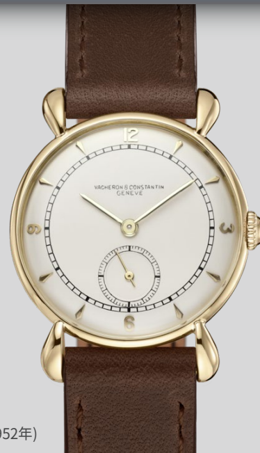
18K黄金腕表 (参考编号4642, 诞生年份:1952年)

其中，1953年问世的18K黄金腕表(参考编号4642)，展现出二战后的制表风格。垂直缎光纹镀银表盘布局简洁，点缀小秒针以及简约利落的时标和刻度，更彰显出高级制表风范。1995年的Mercator铂金双逆跳显示腕表(参考编号43050)，是为纪念荷兰数学家兼地理学家杰拉德·墨卡托(Gerhard Mercator)逝世400周年而诞生，表盘生动重现这位地理学家绘制的地图，均经过手工精心雕刻，随后悉心绘制珐琅图案。此款Mercator腕表的灵感源于双逆跳指针设计，象征着绘制地图所使用的圆规，腕表极富原创新意，又不失精致格调。