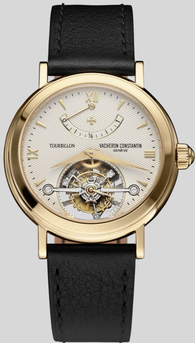
18K黄金动力储存显示陀飞轮腕表 (参考编号30050/000J, 诞生年份:1999年)