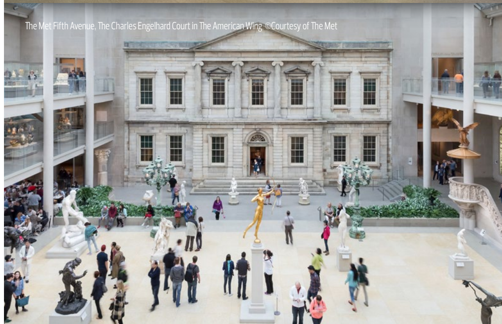
The Met Fifth Avenue, The Charles Engelhard Court in The American Wing