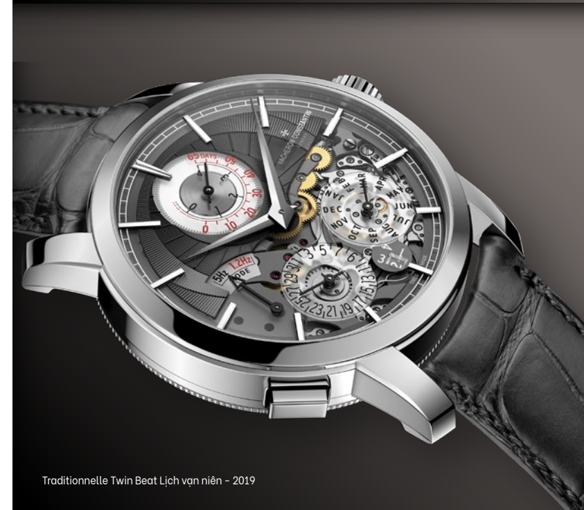
Traditionnelle Twin Beat Lịch vạn niên - 2019