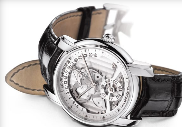
Đồng hồ kim hồi lịch ngày lộ cơ, Ref. 47247-2002