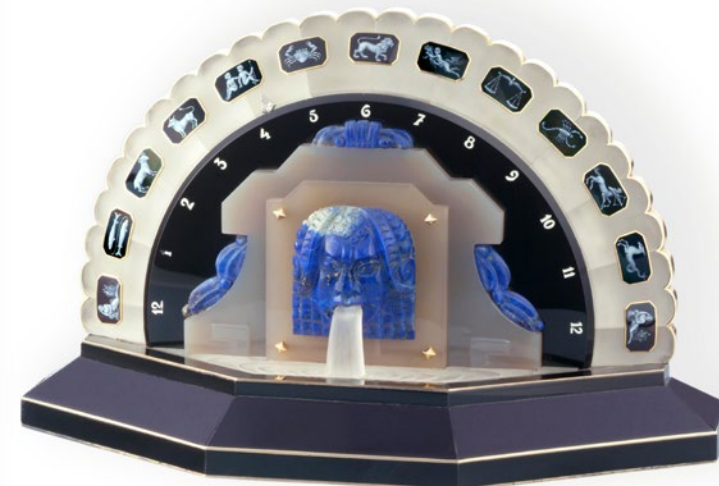
Đồng hồ Art Deco bằng vàng kim, mã não, tinh thể pha lê và lapis lazuli (Ref. Inv. 10548) - 1927

Kế thừa các mẫu đồng hồ mang số tham chiếu 47245 và 47247 từ đầu những năm 2000, chiếc đồng hồ Traditionnelle tourbillon date retrograde openface kết hợp tính năng biểu thị bằng kim hồi với mặt số được gia công lộ cơ bán phần (Openface), một dấu ấn khác của thương hiệu từ đầu thế kỷ 20. Mặt số Openface làm nổi bật bản chất kỹ thuật và sự tỉ mỉ, nhất quán trong từng chi tiết thể hiện dấu ấn thẩm mỹ tiên phong. Sở hữu bộ vỏ bằng vàng hồng 18K với đường kính 41 mm và chỉ dày 11,07 mm, chiếc đồng hồ mới này được trang bị dây đeo cá sấu màu xám được cố định bằng khóa gập bằng vàng hồng.