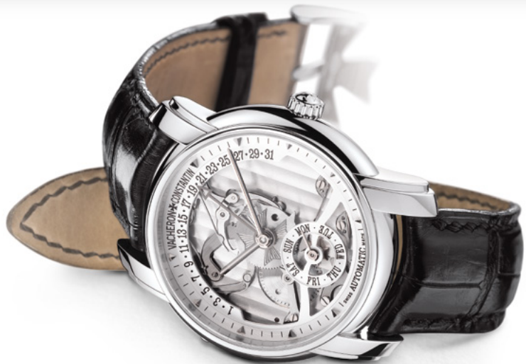
عرض هيكلية ارتجمي للتاريخ من البلاطين، المرجع 2002-47247