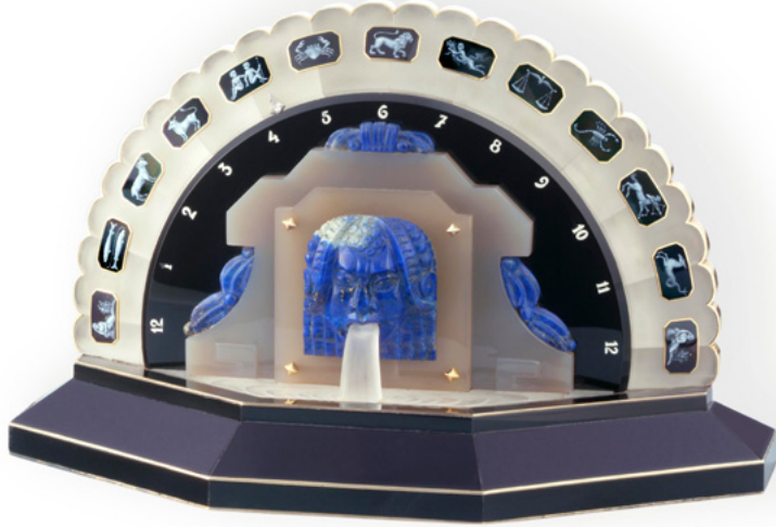
ساعة من حقبة الفن الزخرفي (آرت ديكو) من الذهب الأصفر، الأونيكس، زجاج الكريستال الضخمي واللآزورد (المرجع. 10548) - 1927