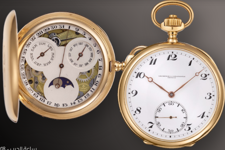
ساعة الجيب - 1918