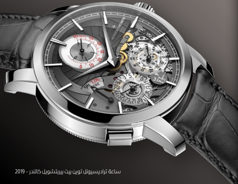
ساعة تراديسيونل توين بيت بيريتشويل كالندر - 2019