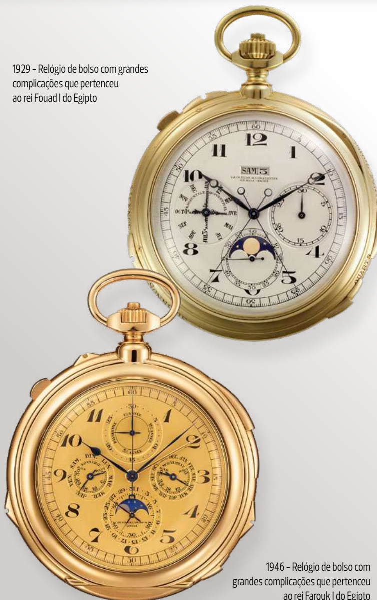
1929 - Relógio de bolso com grandes complicações que pertenceu ao rei Fouad I do Egito

O design do relógio Les Cabinotiers com repetição de minutos e turbilhão - Homenagem ao arabesco é dedicado ao património arquitetónico do mundo muçulmano, com os seus arcos ogivais, cúpulas e mashrabiyas. O trabalho de gravação durou três meses e exigiu uma execução meticulosamente requintada de certas incisões de décimos de milímetro.