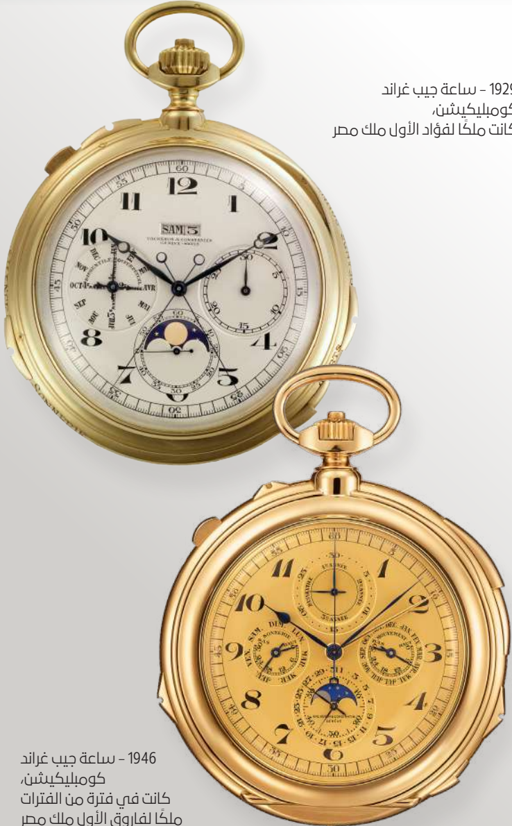
1946 - ساعة جيب غراند كومبليكشن، كانت في فترة من الفترات ملكًا لفاروق الأول ملك مصر