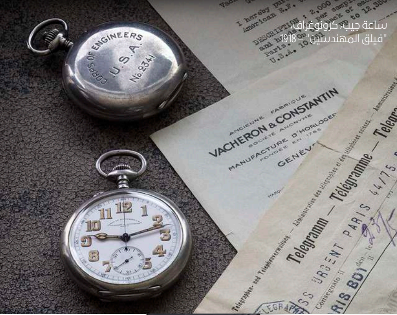
ساعة جيب، كارونوغراف، "فيلق المهندسين" 1918

وكان ذلك أيضًا هو الوقت الذي بدأت فيه ساعة اليد في ترسيخ نفسها كمعيار جديد في صناعة الساعات، مصحوبة بلمسات خيالية نموذجية لروح العصر. تميزت هذه الفترة بشكل خاص بجمالية ساعة أميريكان 1921، التي هممتها فاشرون كونستنتان خلال هذه السنوات من الإبداع المكثف والتي يتم الاحتفال بها الآن مع ساعة "لي كايينوتيه آر ميلاري تورييون - تحية لأسلوب آرت ديكو".