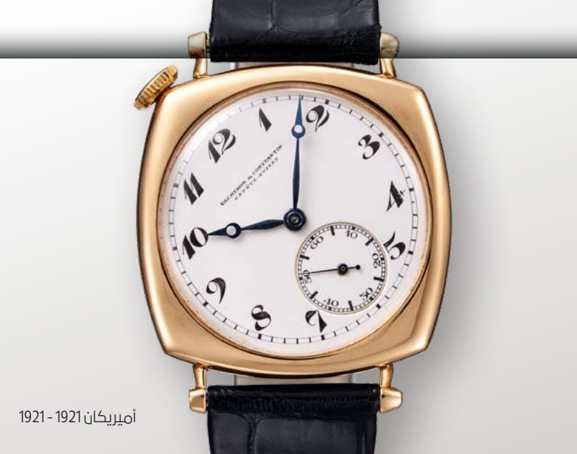
أميريكان 1921 - 1921