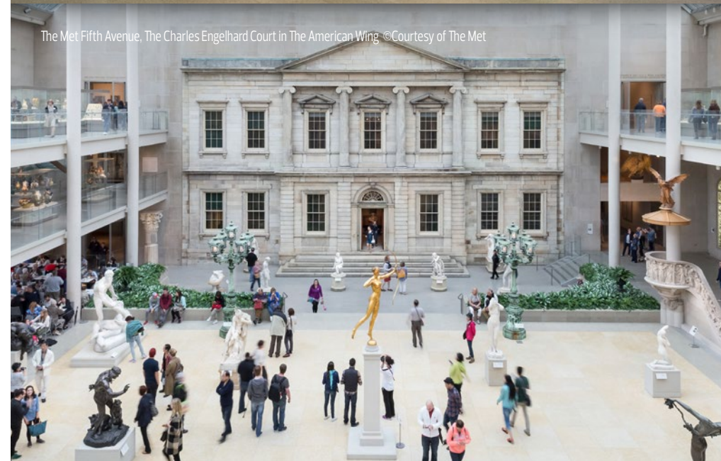
The Met Fifth Avenue, The Charles Engelhard Court in The American Wing