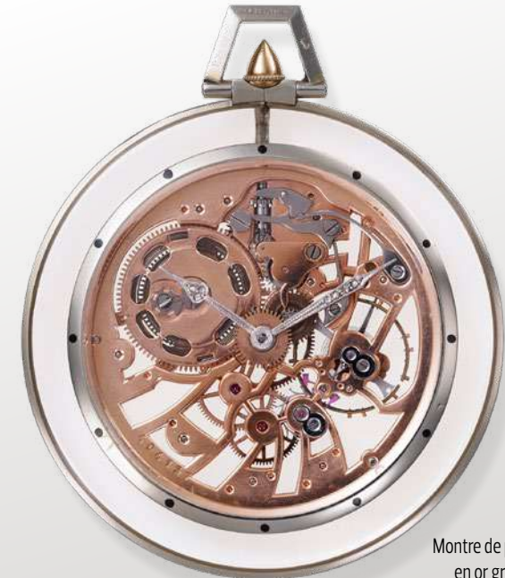
Montre de poche ronde extra-plate, en or gris 18K et cristal de roche.