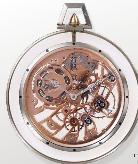
Relógio de bolso redondo ultraplano em ouro branco de 18 quilates e cristal de rocha