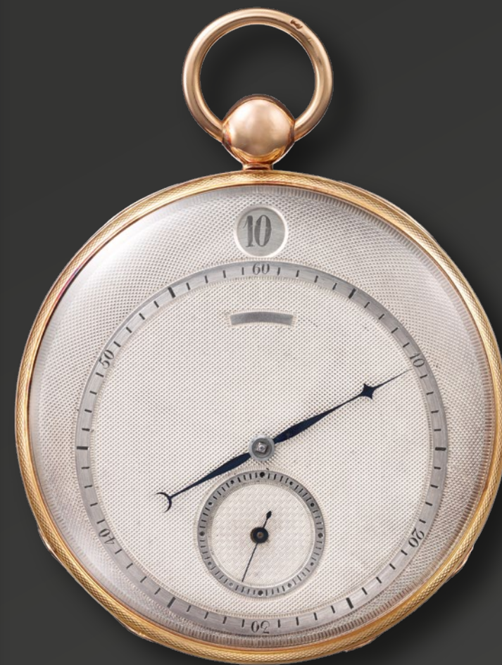
Montre de poche à heure sautante (Ref. Inv. 10132) - 1824