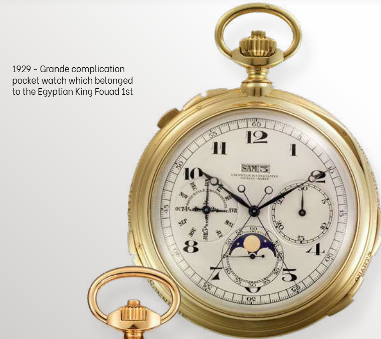
1929 – Grande complication pocket watch which belonged to the Egyptian King Fouad 1st

Thiết kế của Les Cabinotiers Minute Repeater Tourbillon – Tribute to arabesque tôn vinh sự giàu có về kiến trúc của thế giới Hồi giáo với các vòm nhọn, mái vòm và mashrabiya (nghệ thuật chạm khắc gỗ). Công việc khắc mất ba tháng và đòi hỏi sự cẩn thận cực kỳ tỉ mỉ trong việc tạo ra những đường rạch có kích thước 1/10 milimet.