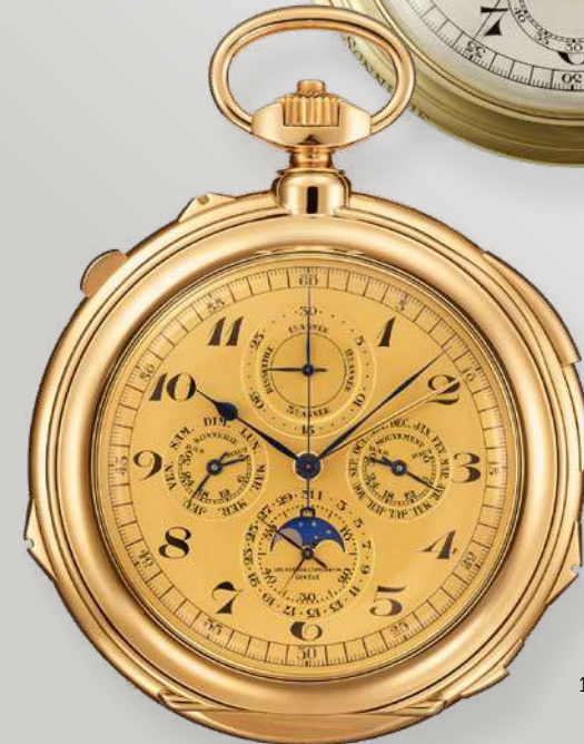
1946 – Grande complications pocket watch once owned by King Farouk I of Egypt