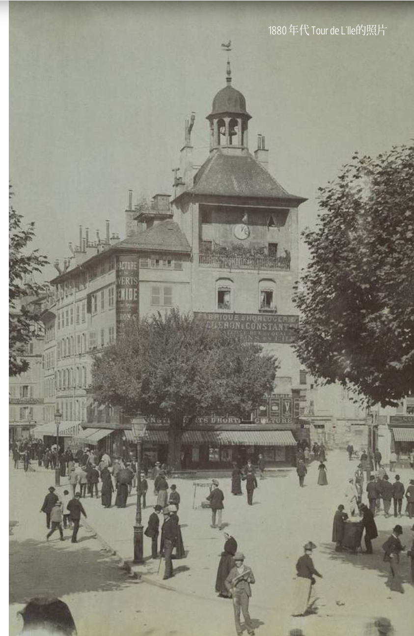
1880年代 Tour de l'Île的照片

亞洲歷來是備受追捧的旅遊勝地，不僅因為其宮殿廟宇等傳統建築令旅遊愛好者心馳神往，在當時更為西方畫家們采風、啟迪靈感提供了理想的土壤與平台。眾多19世紀的藝術家曾以不同風格的畫作記錄了他們眼裡的柬埔寨吳哥城(Angkor Thom)、北京孔廟以及中國皇家園林圓明園，而正是這些作品為本次獨一無二主題作品Les Cabinotiers閣樓工匠 – Memorable places腕錶注入了工藝再創作的源源靈感。這些時計新作回溯了江詩丹頓與遙遠東方綿延一個多世紀的不解情緣，將始於日內瓦的製錶征途再次娓娓道來。基於這一追尋傳承的初心，江詩丹頓自昔日的雕刻工藝中汲取靈感，將日內瓦總部舊址Tour de l'Île鐘樓傳神鐫刻於Les Cabinotiers閣樓工匠 – Memorable places腕錶的錶盤之上。這座鐘樓原屬於Château de l'Île城堡，該城堡於13世紀為抵禦法軍侵襲而興建，曾多次歷經焚燒損壞。1677年，城堡意外損毀，僅餘鐘樓孑然屹立。兩百年後，鐘樓經過修復重建，如今已成為當地的重要歷史遺跡之一。