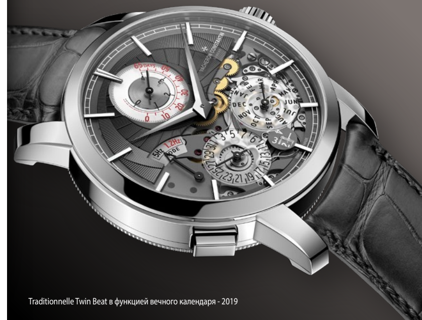
Traditionnelle Twin Beat в функции вечного календаря - 2019