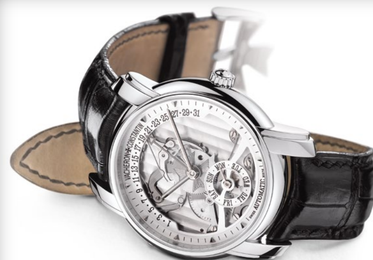
Платиновые скелетированные часы с ретроградной индикацией даты. Реф. 47247-2002