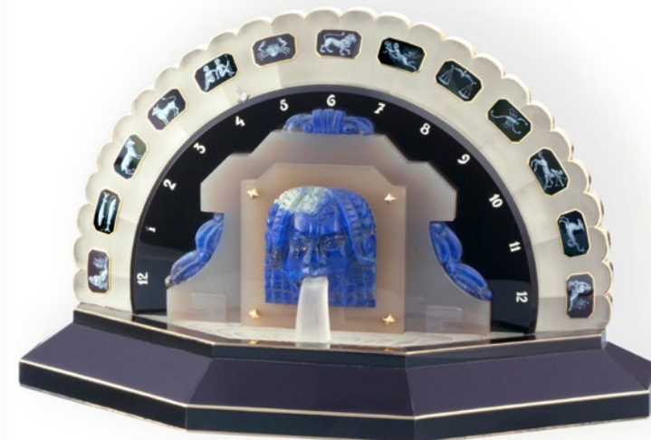
Часы ар-деко из желтого золота, оникса, горного хрусталя и лазурита (Реф. 10548) - 1927 г.

Новые часы Traditionnelle продолжают традицию применения турбийона в сочетании с частично открытым циферблатом, заложенную в артикулах начала нулевых 47245 и 47247, которая стала одной из «визитных карточек» Дома еще на заре XX века. Открытый циферблат в стилистике авангарда подчеркивает техническую природу часов, демонстрируя тщательность исполнения и неустанное внимание к деталям. Новые часы в корпусе из 18-каратного розового золота диаметром 41 мм и толщиной всего 11,07 мм комплектуются серым ремешком из кожи аллигатора с раскладывающейся застежкой из розового золота.