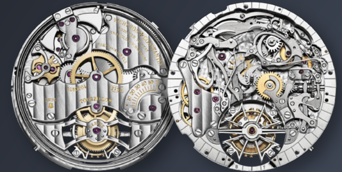
Calibre 2755 TMR