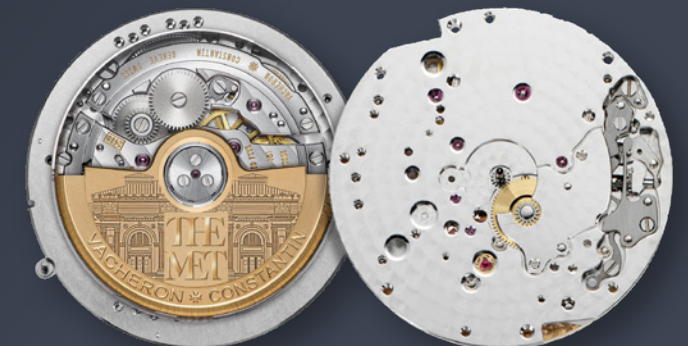
Calibre 2460 SC