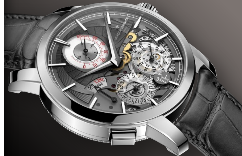
Traditionnelle系列Twin Beat萬年曆腕錶 - 2019年