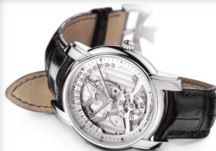
逆跳日曆鏤雕鉑金腕錶，參考編號47247 - 2002年