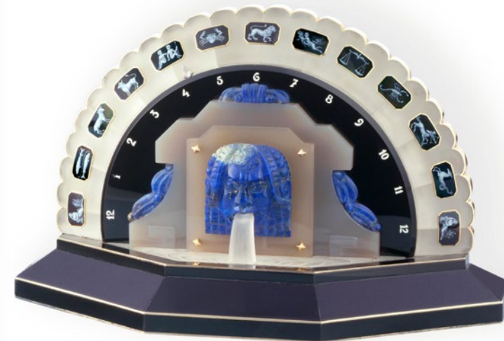
裝飾藝術(Art Deco)座鐘，以黃金、縞瑪瑙、水晶和青金石材質打造(典藏編號10548) - 1927年

以21世紀初問世的參考編號47245和47247腕錶為啟發，新款腕錶不僅具備逆跳顯示，還採用了局部鏤雕錶盤設計，這也是自20世紀初以來江詩丹頓時計作品的另一標誌性特色。這一先鋒的美學設計，將腕錶精湛的技術內涵以及對於入微細節的專注展現得淋漓盡致。此款新作採用直徑41毫米、厚度僅11.07毫米的18K粉紅金錶殼，搭配灰色鱷魚皮錶帶及粉紅金摺疊式錶扣。