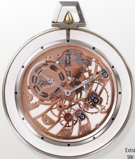
Extra-flat round pocket watch in 18K white gold and rock crystal.