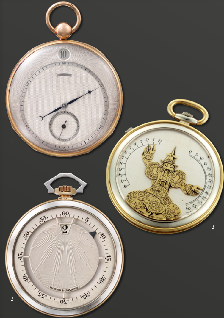
1. 跳时显示怀表（典藏编号10132）-1824年 2. 跳时及跳分显示怀表，以一根表盘下方的指针指示（典藏编号10152）-1929年 3. 魔术师（Arms in the air）双逆跳显示怀表，采用黄金搭配白金材质的双色调设计（典藏编号11060）-1930年

这一合作在1910年至1930年间缔造了无数精妙杰作。此时正值装饰艺术风格盛行，洋溢着自由奔放的想象力，以极尽华丽为美。独特造型的时计如百花齐放，视窗式日期显示随之出现，跳时、逆跳分钟显示等特殊显示设计也陆续问世，成就了诸多为江诗丹顿奠定盛名的经典之作，其中就包括1930年推出的魔术师（Arms in the Air）双逆跳显示怀表。按下10点位的按钮，表盘上以珐琅和雕刻工艺打造的金质魔术师人偶便会举起双臂，指示当前的小时和分钟。另一款非凡杰作可追溯至1929年，搭载跳时显示，并以一根隐藏在表盘下、仅显现玛瑙针尖的指针指示分钟。