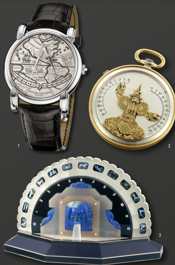
1. Mercator铂金双逆跳显示腕表（典藏编号12055）-2001年 2. 魔术师（Arms in the air）双逆跳显示怀表，采用黄金搭配白金材质的双色调设计（典藏编号11060）-1930年 3. 装饰艺术（Art Deco）座钟，以黄金、缟玛瑙、水晶和青金石材质打造（典藏编号10548）-1927年