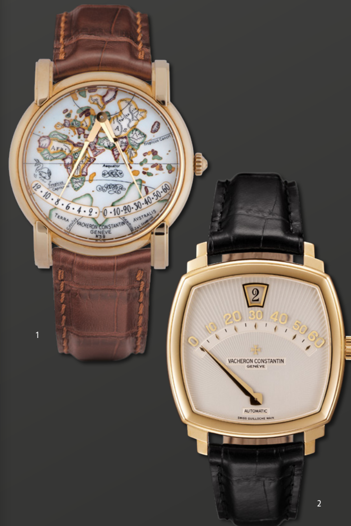
1. Reloj de pulsera Mercator en oro (Ref. Inv. 12130) - 1994