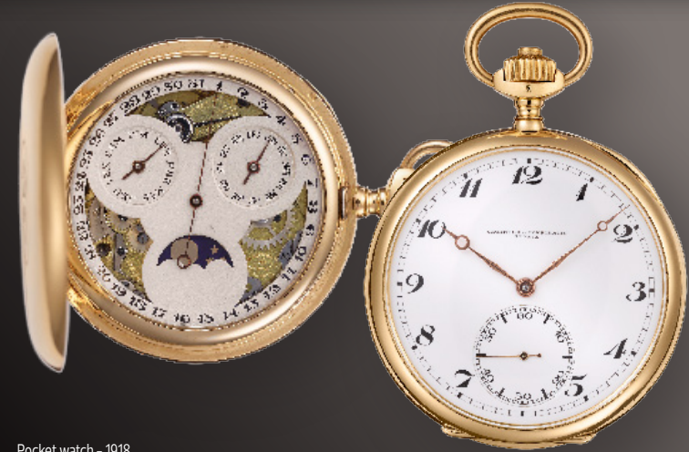
Pocket watch - 1918

ในปี ค.ศ. 2019 เทรดิชันแนลล์ ทวิน บีท เพอร์เพทวล คาเลนดาร์ (Traditionnelle Twin Beat perpetual calendar) ได้กลายเป็นส่วนหนึ่งของการหลอมรวมอันทรงพลัง และการเล่นระหว่างสไตล์อันร่วมสมัยและพลังแห่งประเพณี โดยการสร้างหลักไมล์ครั้งสำคัญ ขณะที่สองปีต่อมา หรือในปี ค.ศ. 2021 การตีความหมายใหม่ได้ถือกำเนิดขึ้นกับผลงานรุ่น เทรดิชันแนลล์ โอเพนเฟซ คอมพลีท คาเลนดาร์ (Traditionnelle openface complete calendar) โดยหมายเลขอ้างอิงอันเปี่ยมด้วยสไตล์นี้ได้นำเสนอภายใต้ตัวเรือน 41 มม. ทำจากไวท์โกลด์หรือฟังก์โกลด์ พร้อมด้วยหน้าปัดกระจกแซฟไฟร์แบบโอเพนเฟซที่เปิดเผยความงามสู่ความเป็นไปได้แห่งการสร้างสรรคใหม่ๆ โดยการผสมผสานประเพณีการประดิษฐ์นาฬิกาและมรดกเข้ากับงานออกแบบอันร่วมสมัย