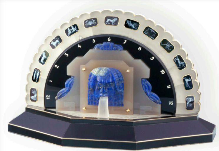
Yellow gold, onyx, rock crystal and lapis lazuli Art Deco clock (Ref. Inv. 10548) – 1927

โดยทายาทของรุ่น References 47245 และ 47247 จากต้นยุคนอตตี (Noughties) อย่าง เทรดิชันแนลล์ ทูร์บิฌอง เรโทรเกรด เดท โอเพนเฟซ ได้ผสมผสานการแสดงแบบเรโทรเกรดเข้ากับหน้าปัดแบบเปลือยโปร่งหรือโอเพนเวิร์กบางส่วนที่ถือเป็นอีกหนึ่งเอกลักษณ์ของเมซงมานับตั้งแต่ต้นศตวรรษที่ 20 โดยหน้าปัดโอเพนเฟซได้ถ่ายทอดความโดดเด่นของธรรมชาติทางเทคนิค และความเอาใจใส่อย่างพิถีพิถันและมั่นคงสู่รายละเอียด ผ่านการเข้าถึงซึ่งสุนทรียะความสวยงามอันล้ำสมัย โดยบรรจุภายใต้ตัวเรือนฟังก์ชิลด์ 18 กระรัต วัดขนาดเส้นผ่านศูนย์กลางได้ 41 มม. และหนาเพียง 11.07 มม. เรือนเวลาใหม่นี้ติดตั้งด้วยสายหนังจะเซ็ลิตา ยึดอย่างปลอดภัยด้วยตัวปรับล็อกสายฟังก์ชิลด์