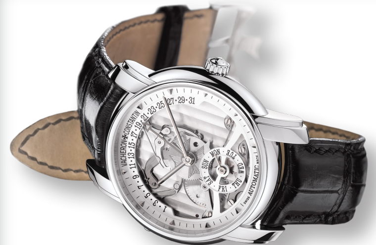
Skeletonized retrograde date platinum, Ref. 47247-2002