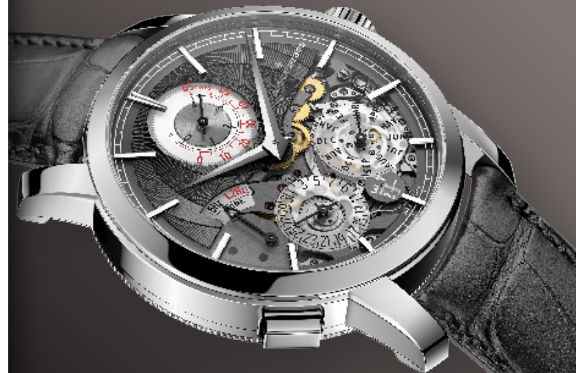
Traditionnelle Twin Beat perpetual calendar - 2019